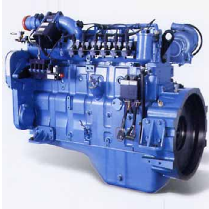
Spécifications du moteur à gaz naturel 8.3L